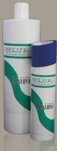
Synthetik-Shampoo 250 ml / 1000 ml Art: 3625211 / 3625111