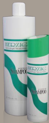
Echthaar-Shampoo 250 ml / 1000 ml Art: 3625218 / 3625118