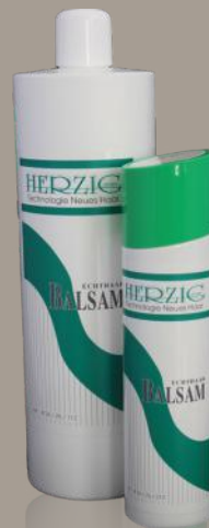
Echthaar-Balsam 250 ml / 1000 ml Art: 3625212 / 3625112