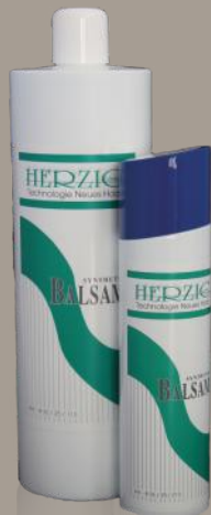
Synthetik-Balsam 250 ml / 1000 ml Art: 3625213 / 3625113