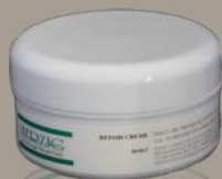
Repair-Creme 150 ml Art: 3625120